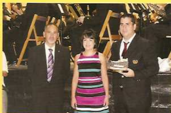
Concejala de Festejos y presidentes de ambas sociedades

En la mañana del domingo, nuestra agrupación acompañó al predicador desde el Colegio Ntra. Sra. del Carmen hasta la Parroquia de Ntra. Sra. de la Asunción. En la tarde se celebró la procesión a la Virgen de los Frutos y así finalizaban estas fiestas en las que esta sociedad participa dentro de los actos correspondientes al Ilmo. Ayuntamiento.