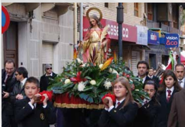
los nuevos músicos portan la imagen de Sta. Cecilia

Al finalizar la Santa Misa, se regresó de nuevo con la imagen al local social en donde se ofreció un vino de honor a todos los asistentes.