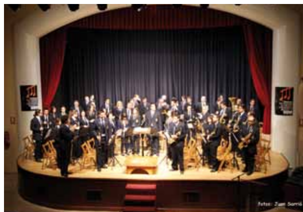
“Asociación Musical Virgen del Remedio” de Petrer

La Sociedad petrerense, amenizó este concierto con un programa muy ameno, aunque la asistencia no fue masiva, debido a las numerosas actividades celebradas en nuestra población, el público asistente, disfrutó de una buena mañana musical.