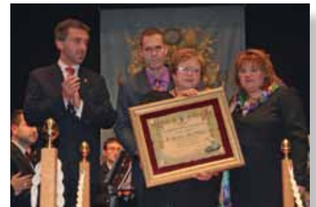
Homenaje a Salvador Martí Ochoa

Tras finalizar el concierto, músicos y acompañantes nos trasladamos al Salón Buenos Aires en donde se celebró la Cena de Hermandad. Todos pasamos una buena noche disfrutando de un buen menú reinando el buen humor y la buena convivencia.