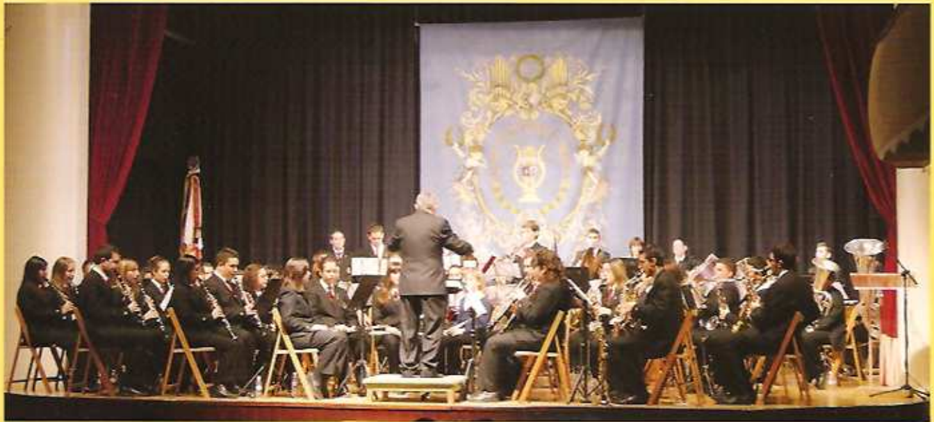
Banda Juvenil de la Sociedad Unión Musical y Artística