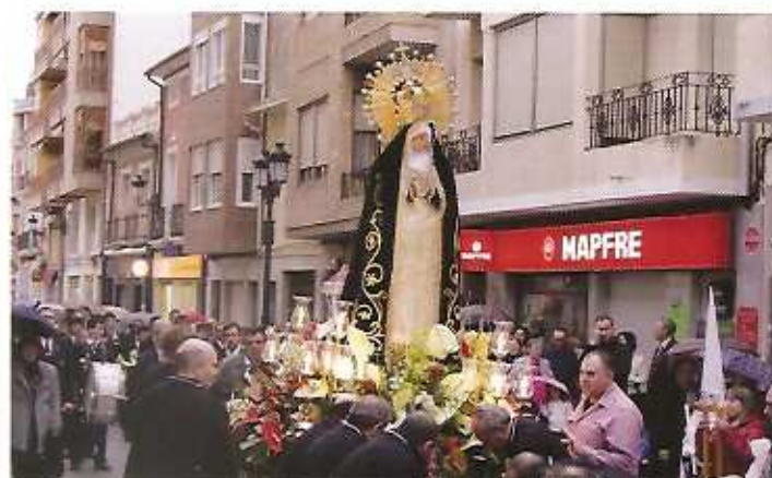
Sábado Santo en Sax