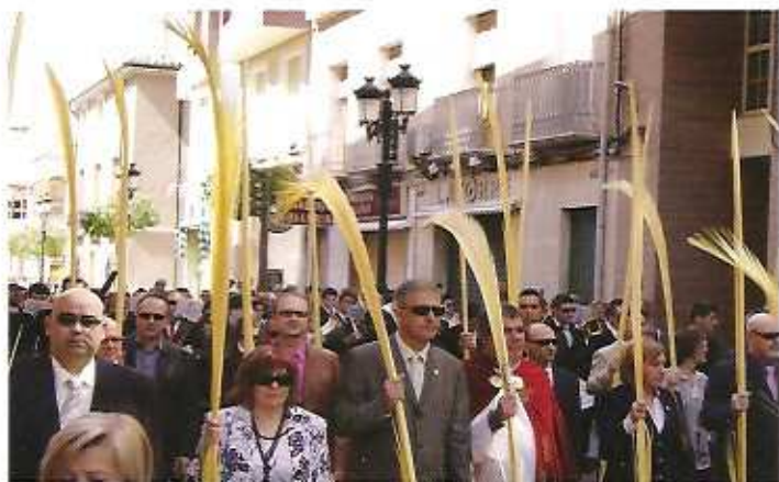
Domingo de Ramos en Sax