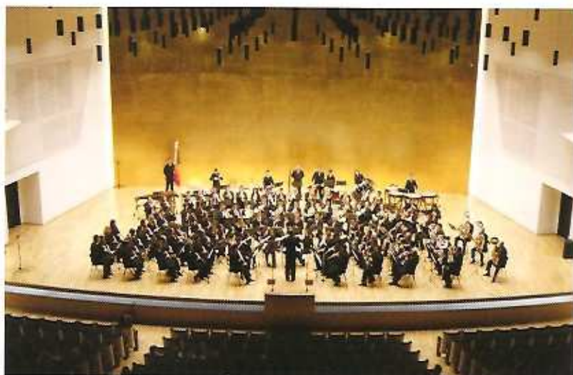
la Unión Musical y Artística durante las actuación en el ADDA

Las obras que se interpretaron fueron "Virgina" de Jacob de Haan y "El Arca de Noé" de Oscar Navarro. En los últimos compases de la actuación, la emoción de los músic@s y de nuestro director se hicieron presentes en el escenario, no era una actuación más, era una despedida.