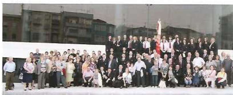
músicos y acompañantes delante del auditorio

Antes de regresar a nuestra localidad todos los que hasta allí nos trasladamos, immortalizamos este momento en la puerta del maravilloso auditorio, el cual, siempre recordaremos como un lugar en donde la Sociedad Unión Musical y Artística hizo una de sus actuaciones más recordadas para su historia.