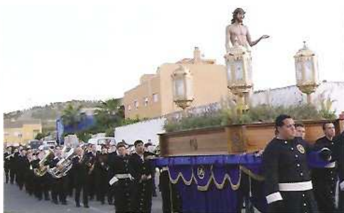
Miércoles Santo en Aspe