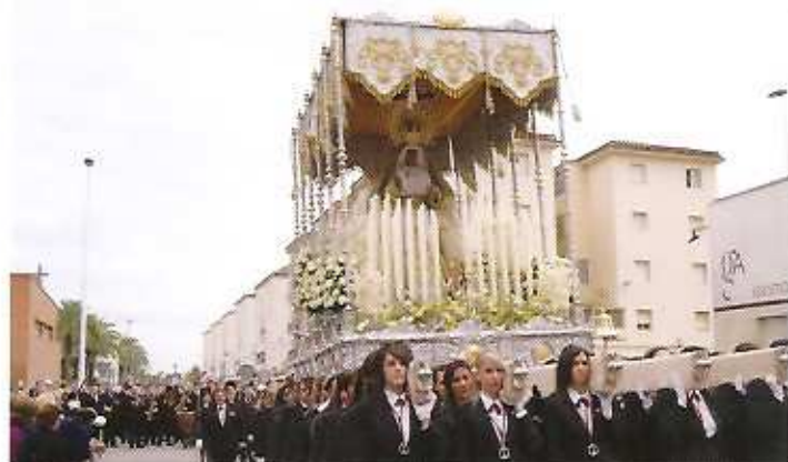
Jueves Santo en Elche

A pesar de una amenazadora lluvia durante toda la semana, las procesiones pudieron celebrarse con normalidad en todas las localidades, excepto el Traslado de la Virgen de la Soledad, en nuestra localidad, la cual, por culpa de la lluvia, no pudo lucirse con todo su esplendor.