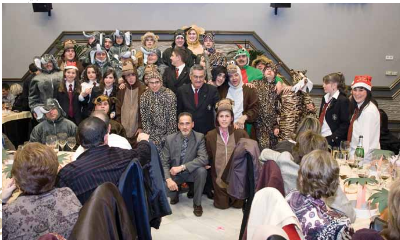
Componentes del grupo de animación del espectáculo de la Cena de Hermandad