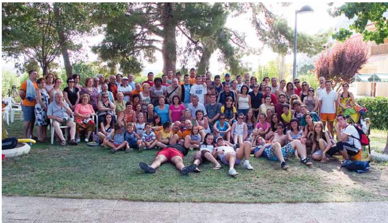
Grupo de asistentes de nuestra Sociedad a la convivencia en Xorret de Catí 2009