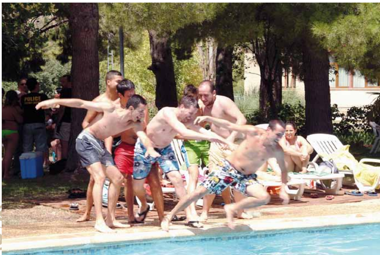
Músicos divirtiéndose durante la convivencia en Catí