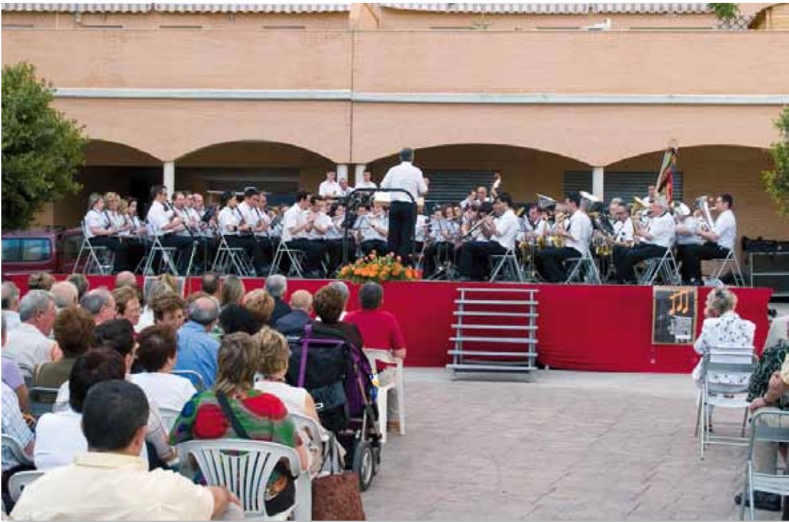
Concierto en Meliana (Valencia) de nuestra sociedad