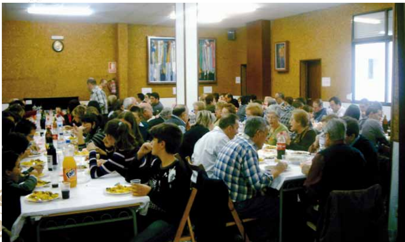
Comida de Hermandad en el local social