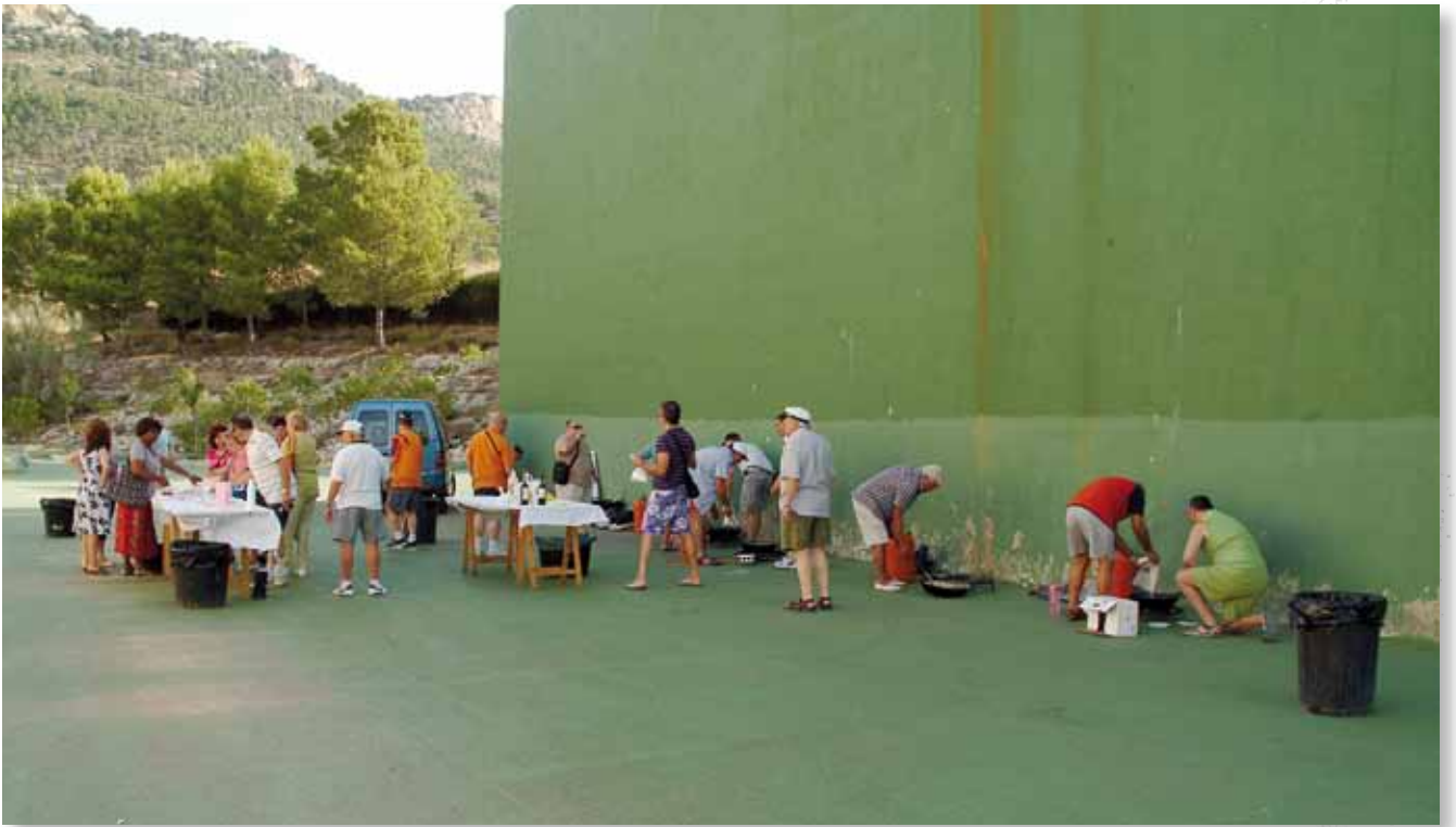
Acompañantes y músicos preparando el almuerzo en la convivencia