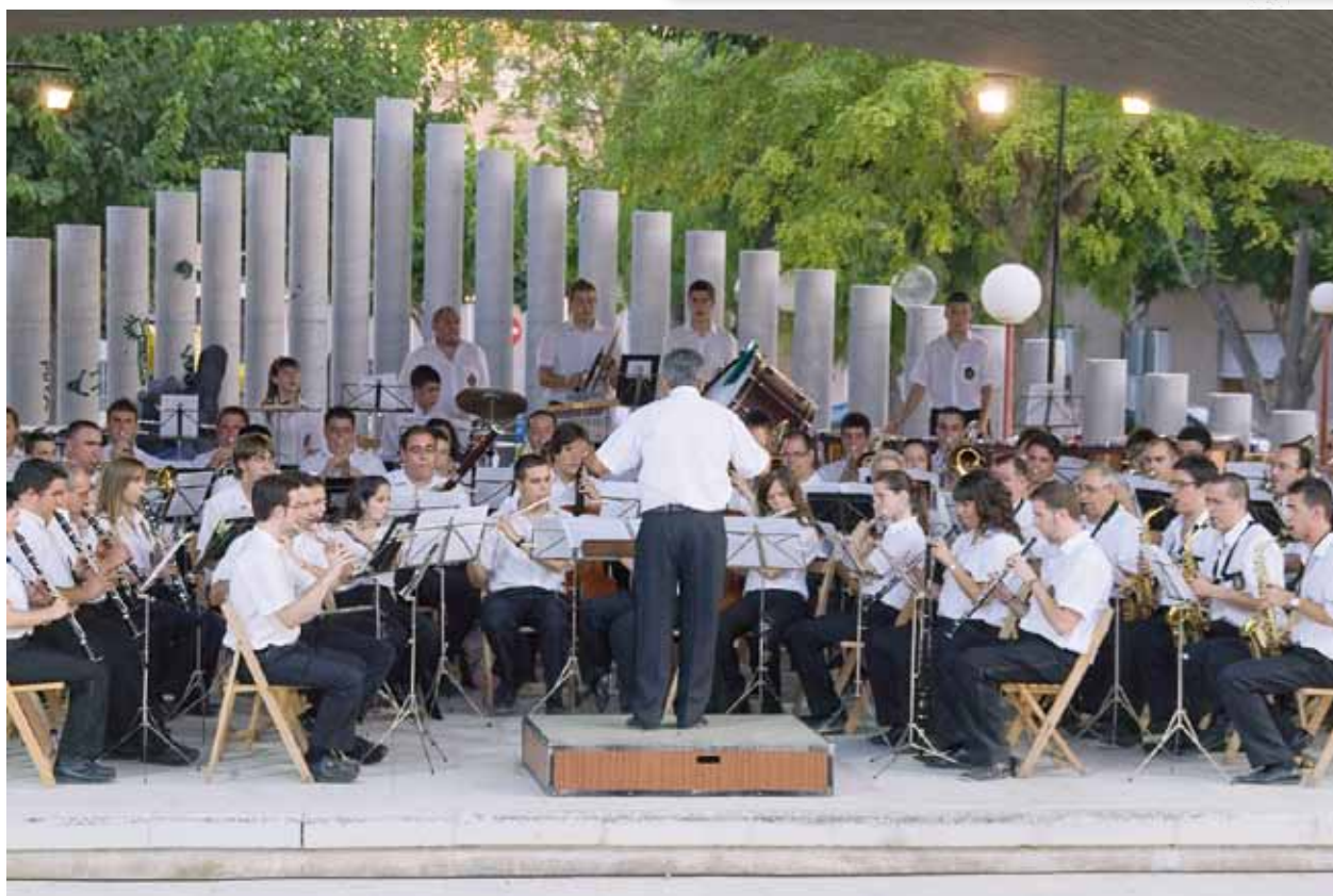
Festival de Bandas en San Vicente del Raspeig