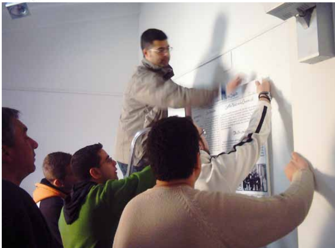
Organizadores de la exposición durante su montaje en el CEAHM Alberto Sols