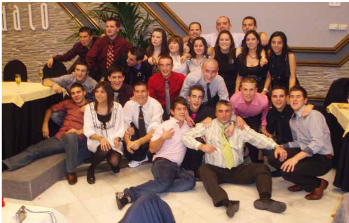
Grupo de asistentes a la cena de hermandad 2008