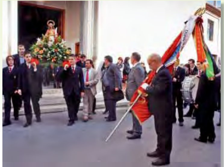
Festividad de Santa Cecilia 2009