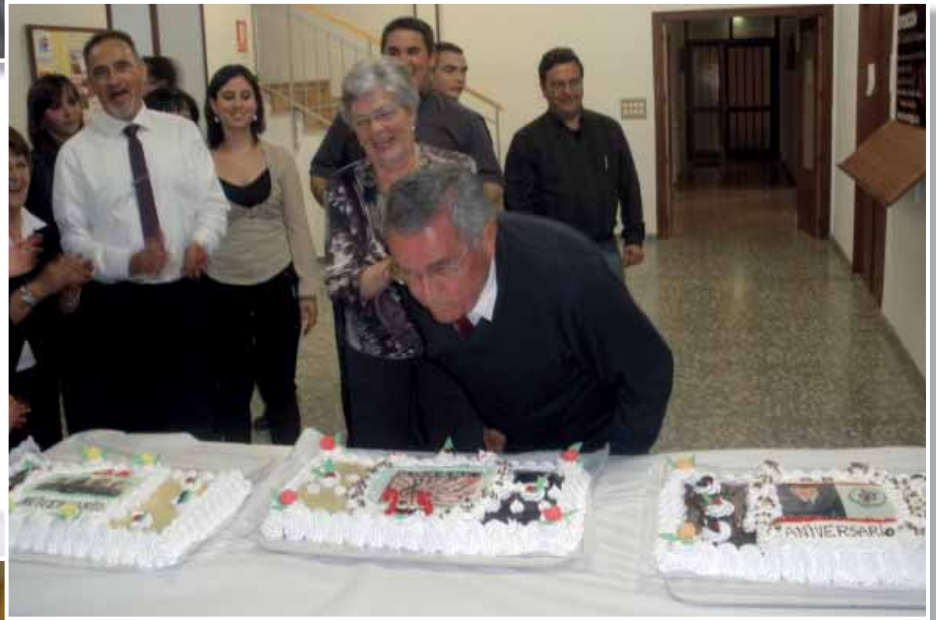
El Maestro soplando las velas de su 25 Aniversario en la cena posterior