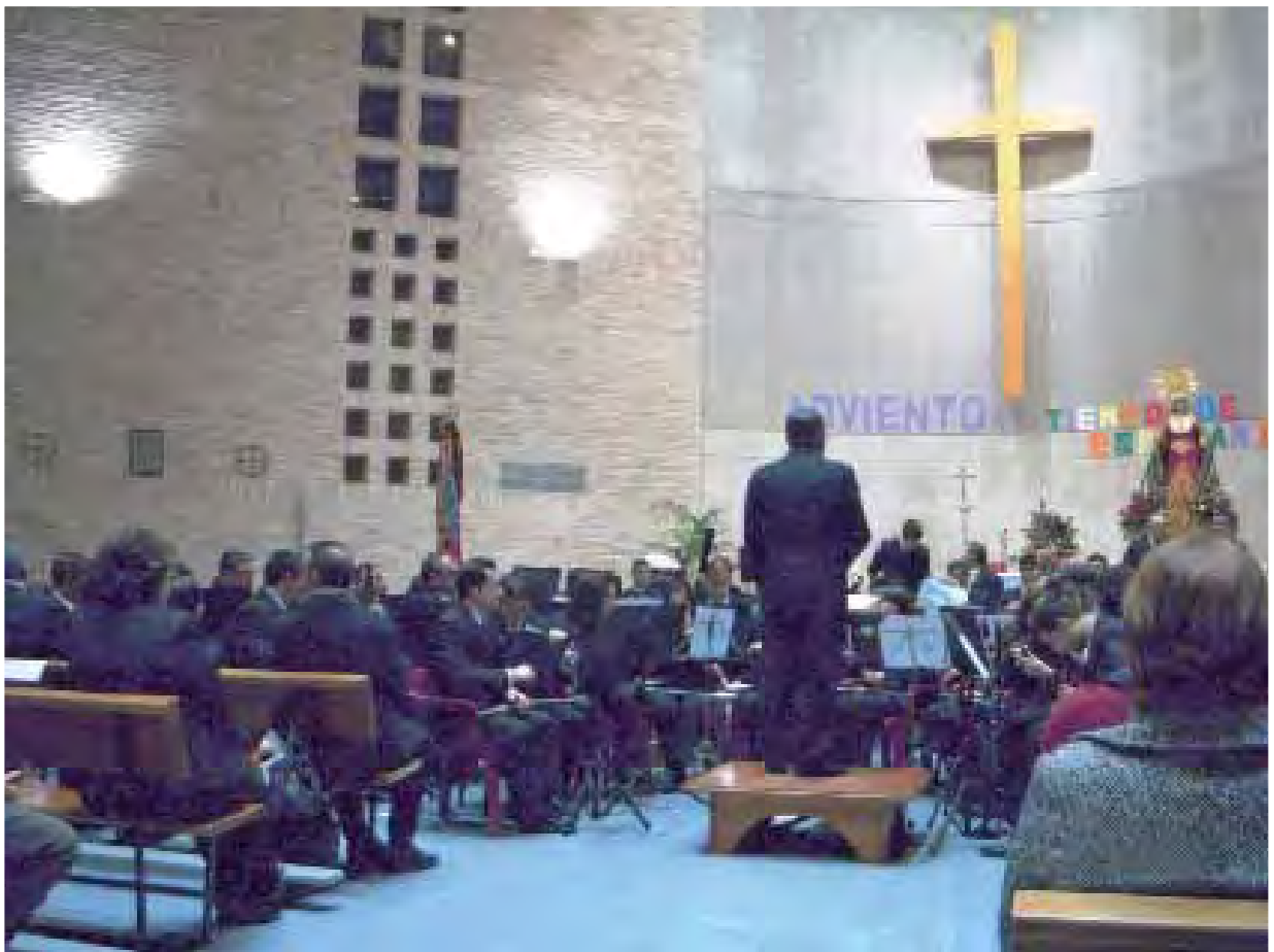
19-12-2009 Concierto con la Hermandad del Santísimo Cristo del Perdón y M a Santísima de la Humildad de Aspe en el III Concierto Solidario de la Campaña del Kilo en la iglesia de San Pascual de Elda.

2-10-2010 Actuación con la Comparsa de Dragones en las Fiestas de Crevillente.