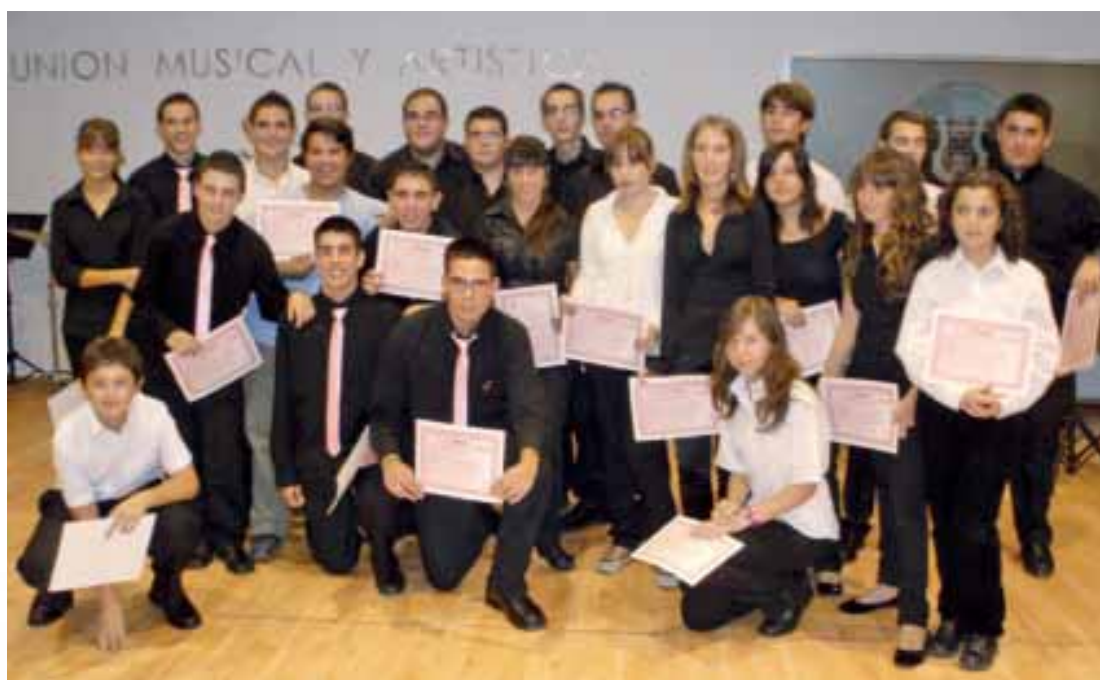
Participantes de la Fase Local del Certamen de Interpretación Instrumental del año 2009

Fase Local , Audición de Interpretación Instrumental del Vinalopó en el salón de Ensayos "Roberto Trinidad Ramón" del Local Social de la Banda. 17.00h.