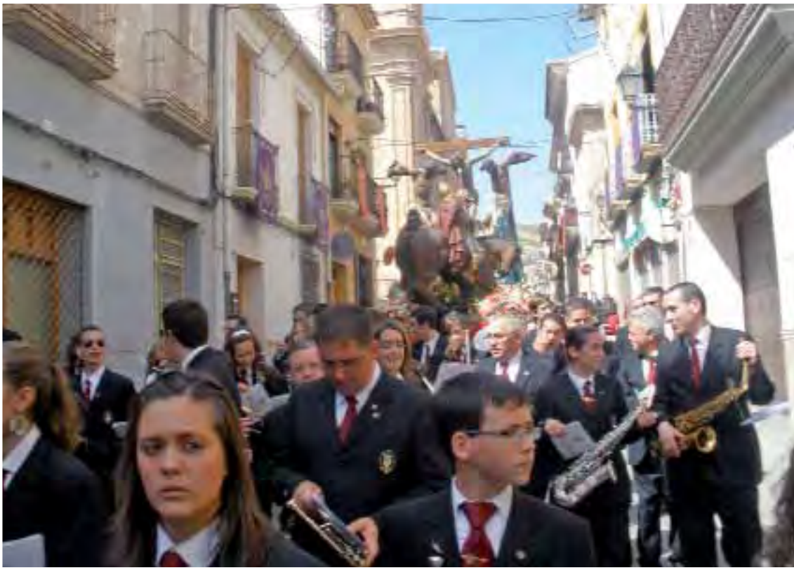
02-04-2010 Procesi3n en Jumilla con la Cofradía del Santo Costado de Cristo