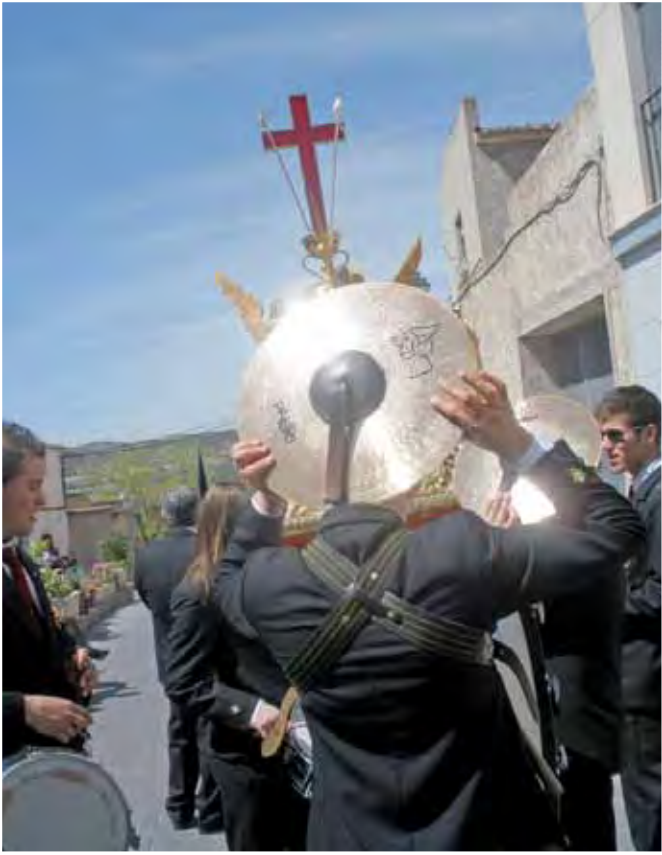
Bajo el sol jumillano