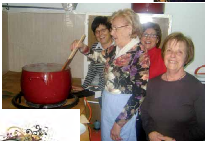
Parte de las Cecilianas preparando chocolate