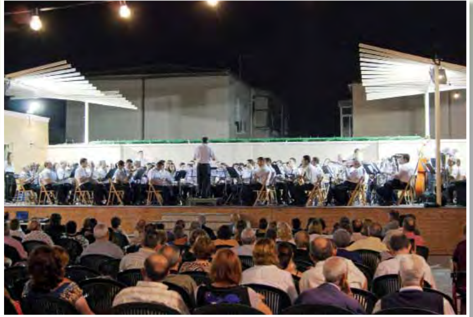
23-07-2010 Concierto en el Barrio Hispano América.