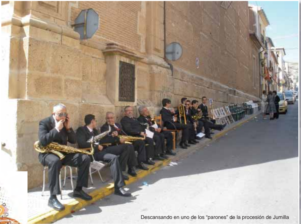
Descansando en uno de los "parones" de la procesión de Jumilla