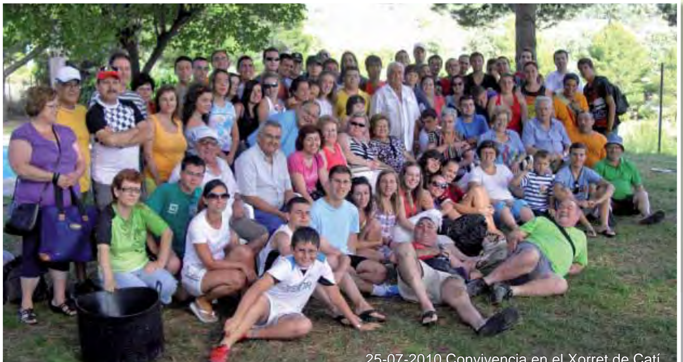
25-07-2010 Convivencia en el Xorret de Catí