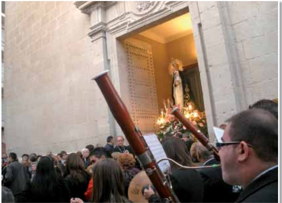
03-04-2010 Traslado de la Virgen de la Soledad en Sax