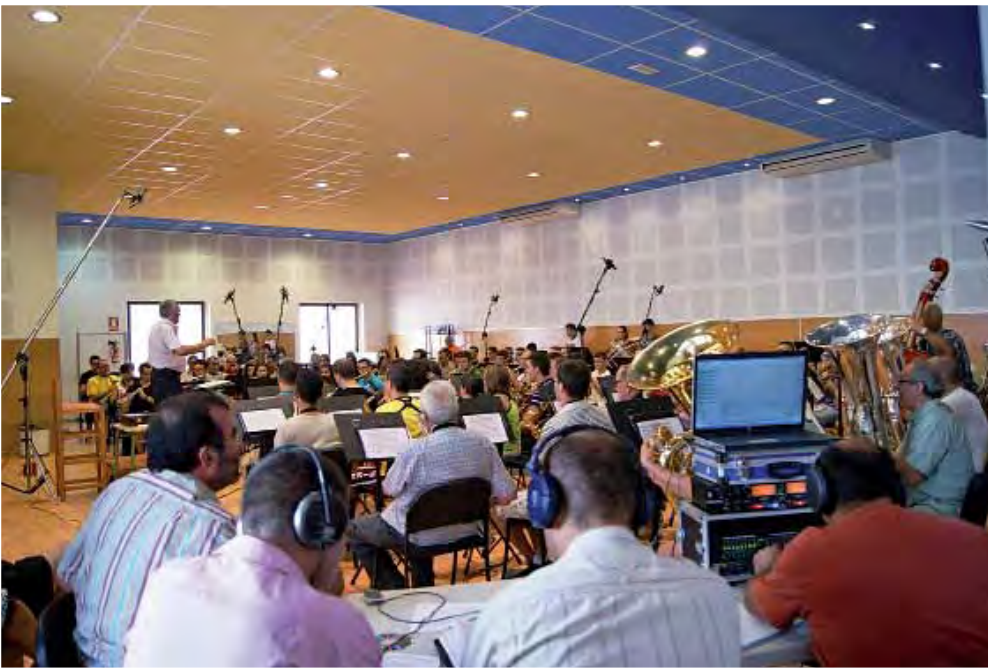
24-07-2010 Grabación del CD Alagoneses 40 Aniversario en nuestro local social.