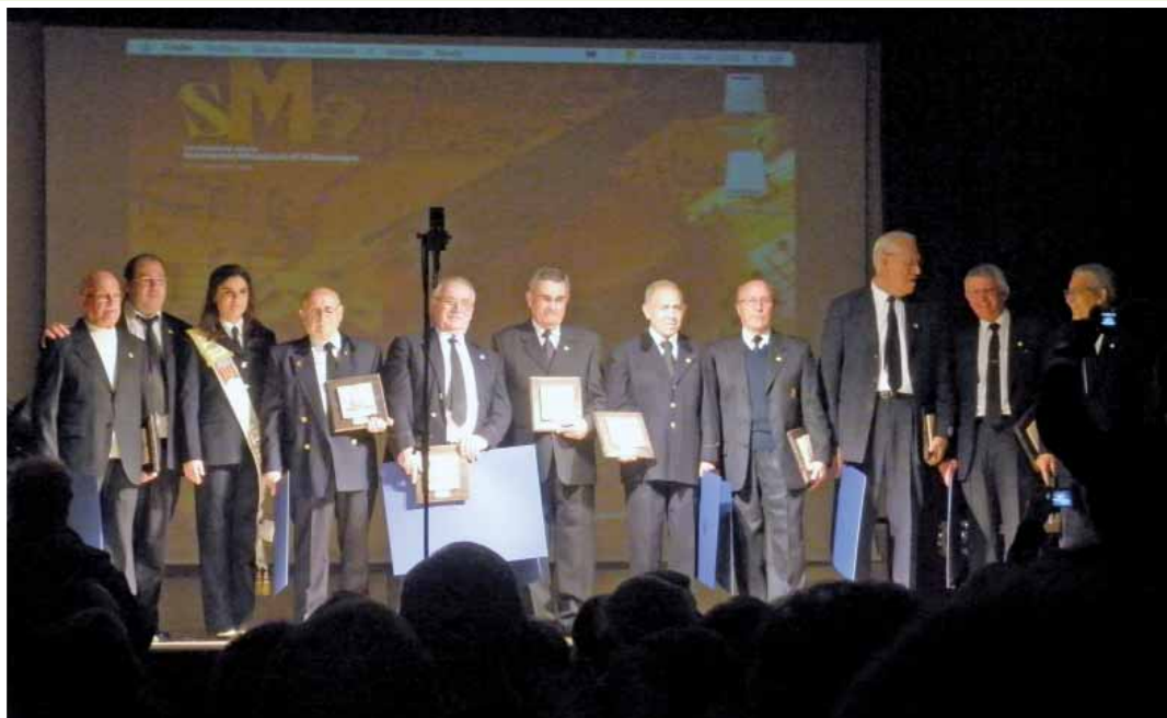
13-12-2009 Asistencia al homenaje en honor del Maestro a Alboraya.