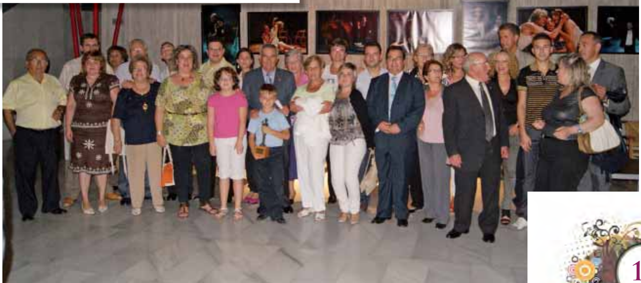
18-09-2010 Asistencia a la XI Gala de los Premios Euterpe donde se le concedió al Maestro el Premio a la Trayectoria en la Dirección de Bandas.