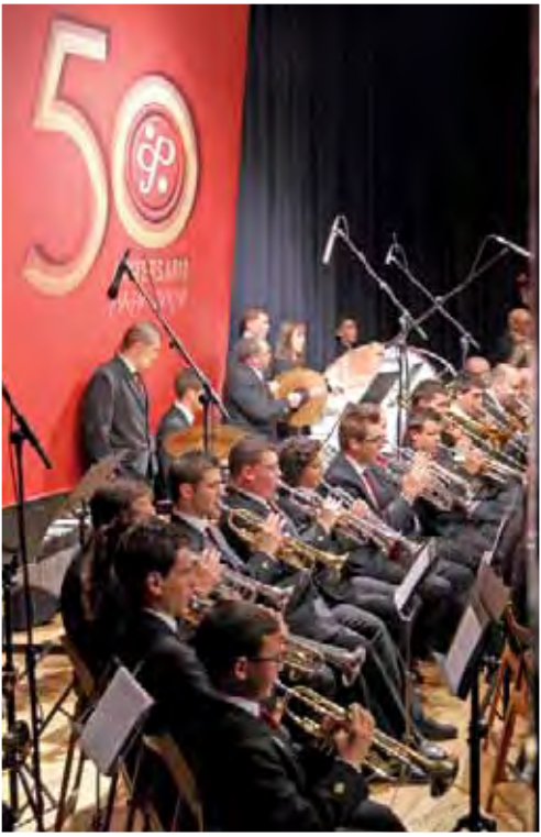
24-04-2010 Concierto de Clausura del 50 Aniversario de la empresa Giménez Ganga.