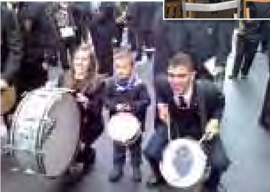
Percusión con un "nuevo percusionista" en la festividad de San Sebastián