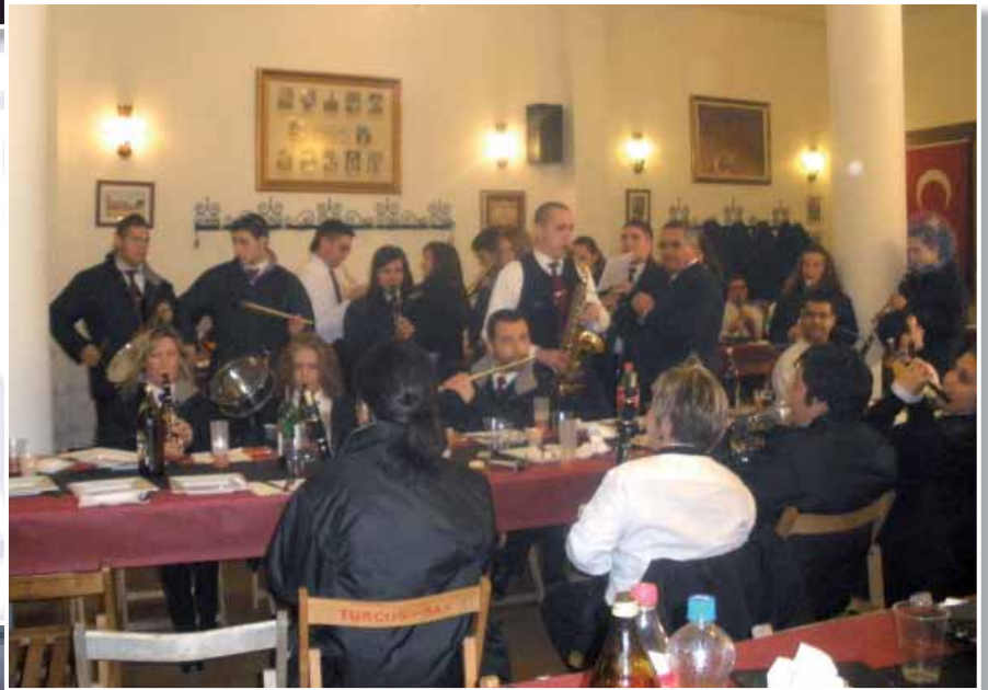
En los Turcos durante la festividad de los Amigos de San Blas