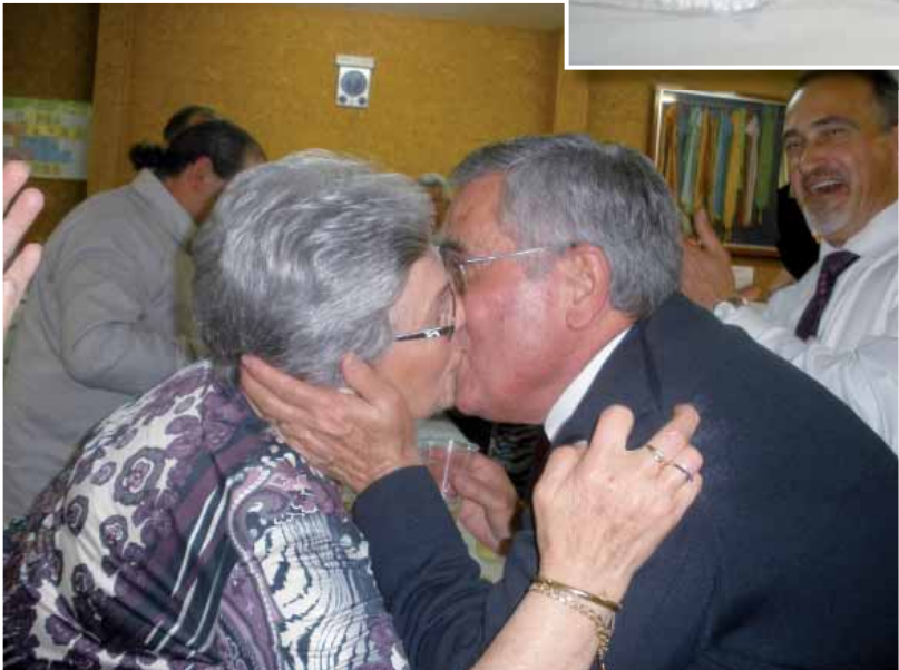
Un beso para la posteridad