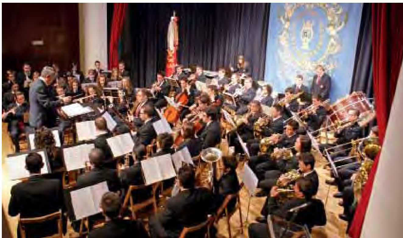
Concierto de la Banda Juvenil en 2009