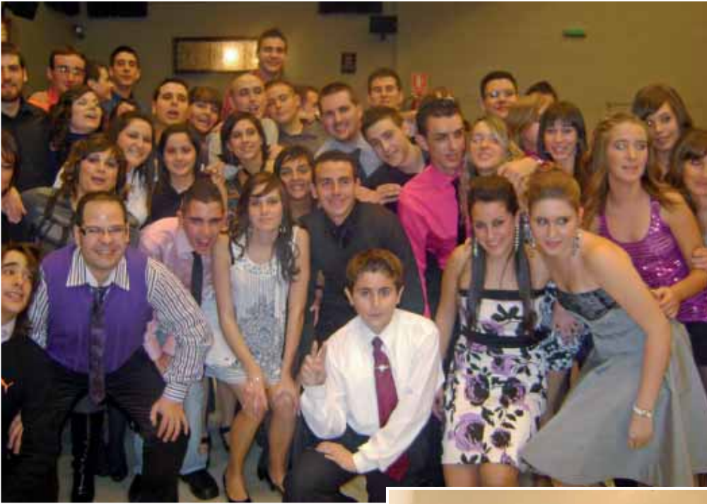
Foto de grupo de la cena de Santa Cecilia 2009