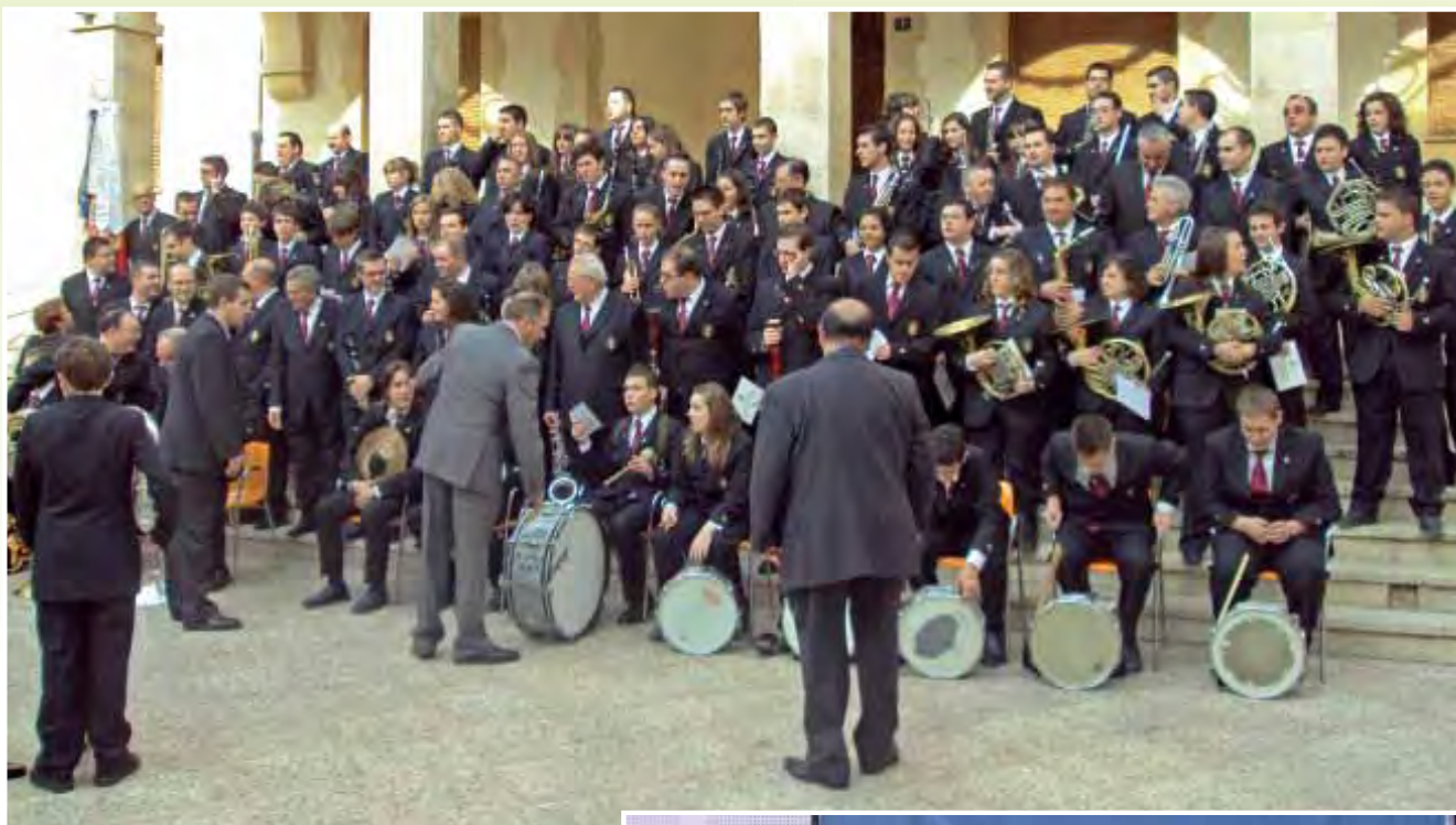
Preparativos para la fotografía oficial de la banda en el año 2009