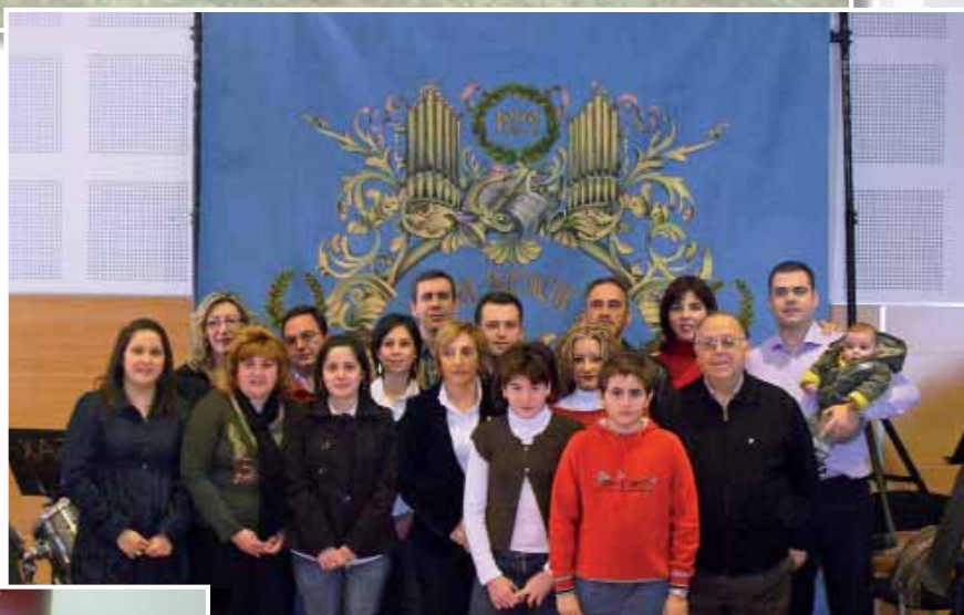
Making-off del vídeo para el homenaje al Maestro en Alboraya.