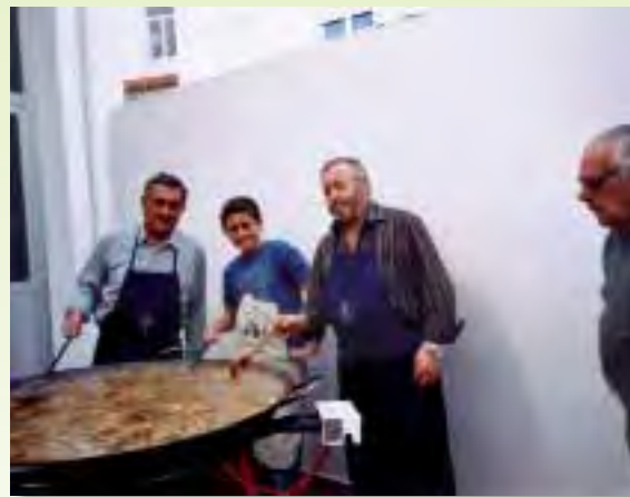
Comida de hermandad del año 2009

CONCIERTO DE LA BANDA JUVENIL , a las 19,00 horas en el Teatro Municipal Cervantes, concierto a cargo de los músicos mas jóvenes de nuestra Banda con la participación de muchos Educandos, incluidos los que a partir de mañana pasaran a formar parte de la misma.