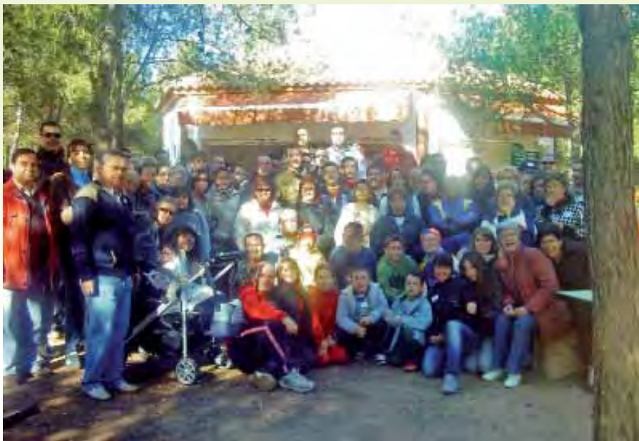
Convivencia en El Plano 2009

A las 17.30 h., en el Salón de ensayos “Roberto Trinidad Ramón”. Después merienda organizada por las Cecilianas.