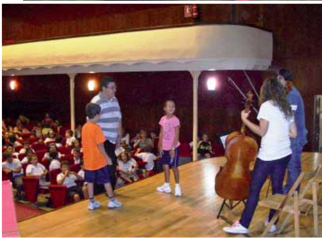
14-09-2010 Audición para los colegios de Sax en el Teatro Cervantes