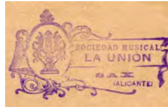
Cuño de La Unión (1929)