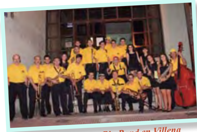
La Big Band en Villena