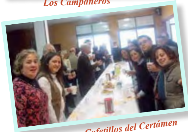
Cafetillos del Certámen