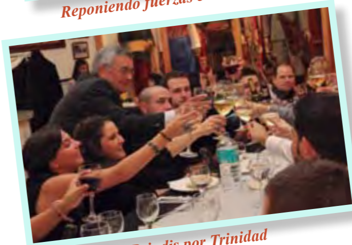
Brindis por Trinidad