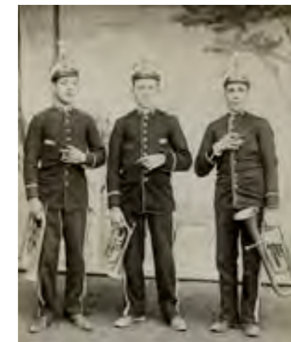
Músicos de La Primitiva (sobre 1906)

Cuando la banda de La Primitiva se veía con recursos económicos, pues contrataban un maestro, pero cuando no podía ser, ya que tenían que comprar trajes, instrumentos, accesorios, etc. pues entonces algunos músicos de la misma se tenían que hacer cargo de la dirección, esperando que llegaran tiempos mejores. Algunos de estos sajeños que fueron directores esporádicos y no tan