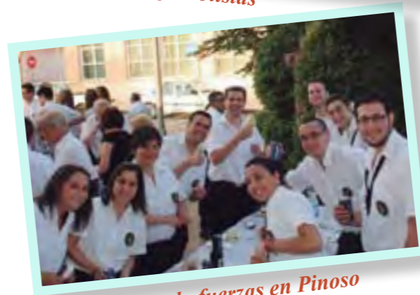
Reponiendo fuerzas en Pinoso