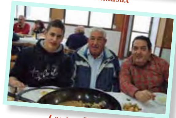
Los tres Palayas