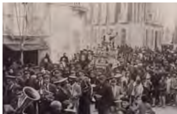
Procesión de San Sebastián (Años 20)