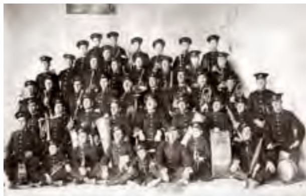
La Primitiva (1909)