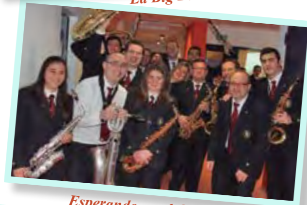
Esperando en el Certámen