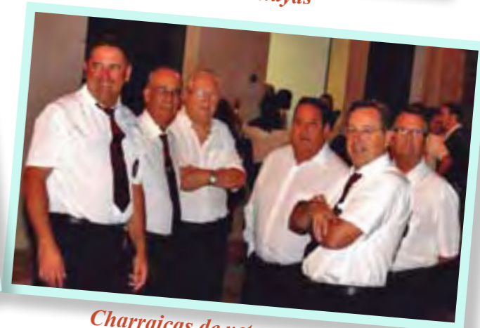
Charraicas de veteranos