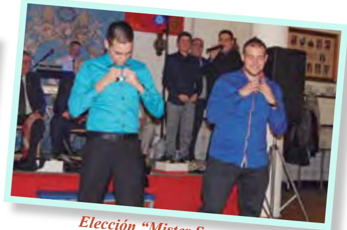
Elección "Mister Sumasax"