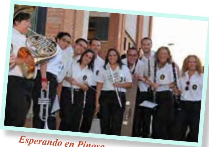
Esperando en Pinoso