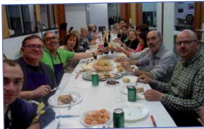
Celebrando el certamen