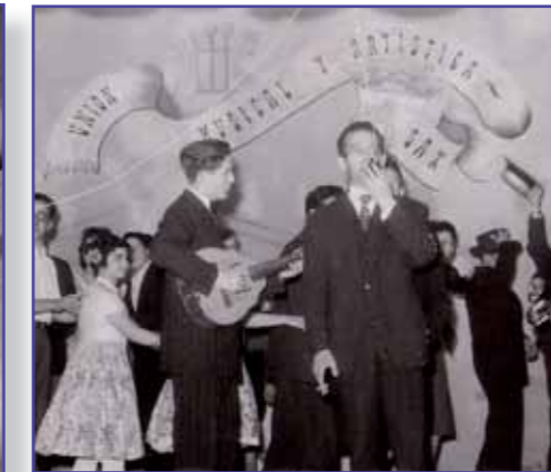
Diferentes actuaciones en las que se puede contemplar como fondo el emblemático logo pintado de la sociedad.