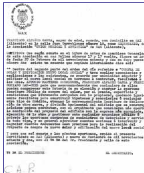
Extracto del acta del acuerdo

Movimientos como la Campaña de Recogida de Donativos en el día de Navidad fueron puestos en marcha, en los que la agrupación recorría las calles del pueblo, pasando por calles que según los vecinos jamás había pasado por allí las bandas de música, una de ellas, la calle Olivo, situada junto a la peña del castillo. Yo recuerdo como la gente tiraba desde los balcones billetes de cien, quinientas y mil pesetas (algunos sujetos con pinzas para que no se volaran) y todo ello para hacer posible y aportar un pequeño grano de arena a aquello que era la gran ilusión de esta sociedad: la construcción de su nuevo local. Aquel primer año (1983) se recogieron 241.000 pesetas.