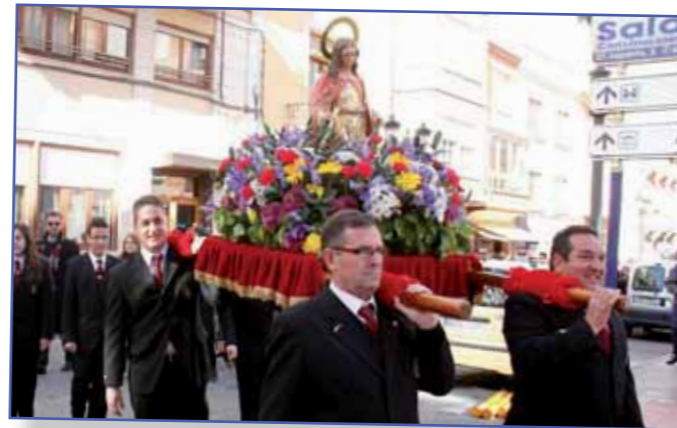
Sta. Cecilia con los mayores