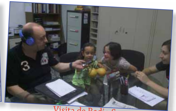
Visita de Radio Sax