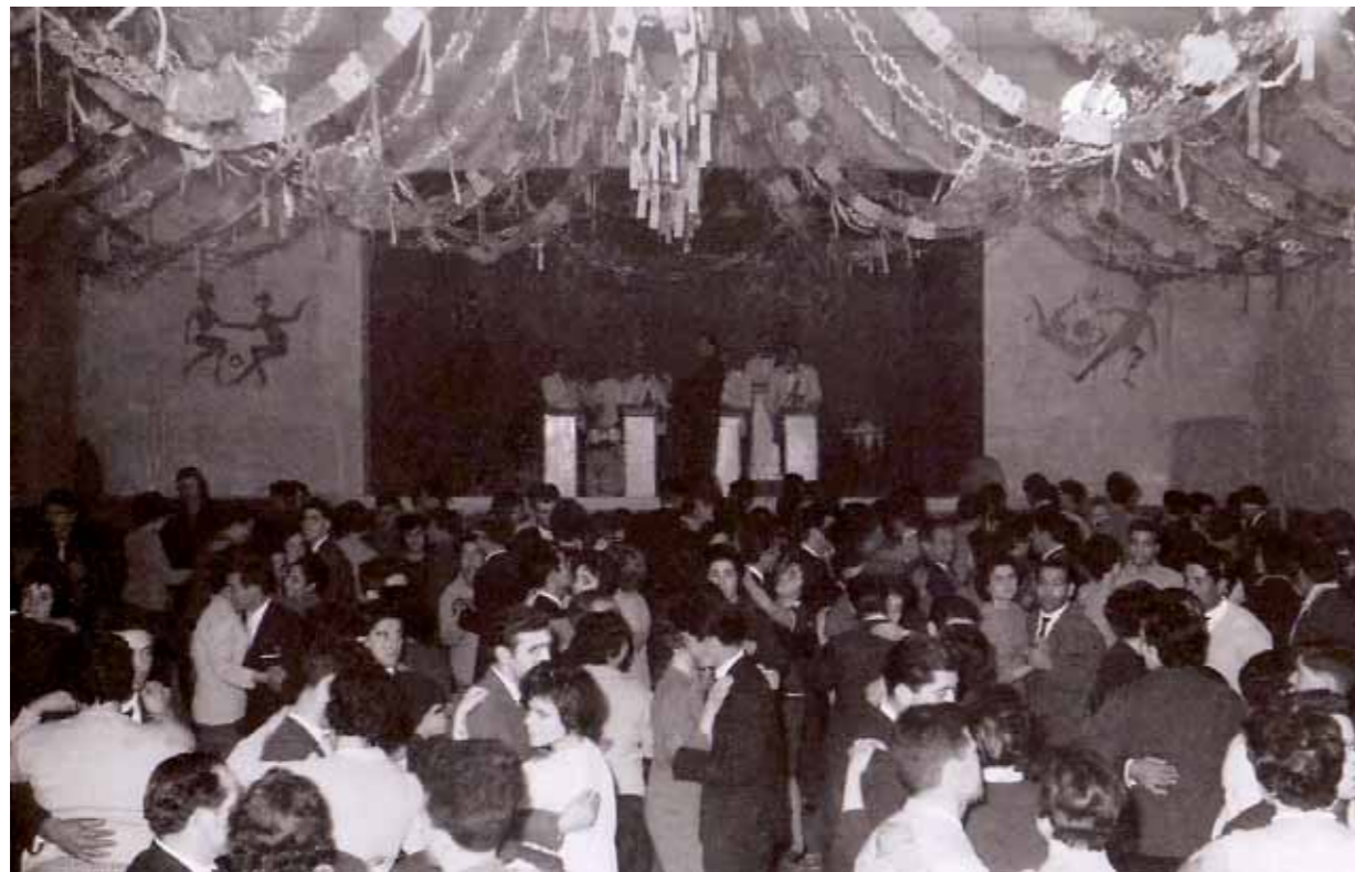
Una de las sesiones de baile con la actuación de la Orquesta Copacabana

Con esta publicación, agradecemos a la Mayordomía de San Blas su gran detalle a esta Sociedad, por aportarnos un poco más de nuestra historia reflejada en imágenes.