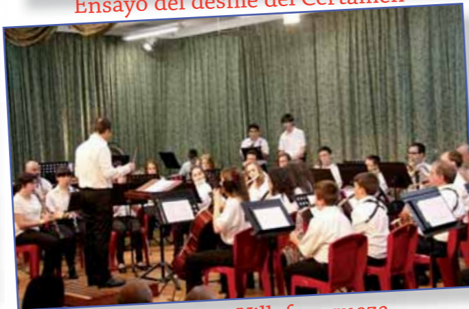
Educandos en Villafranqueza