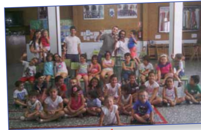
La escuela de verano