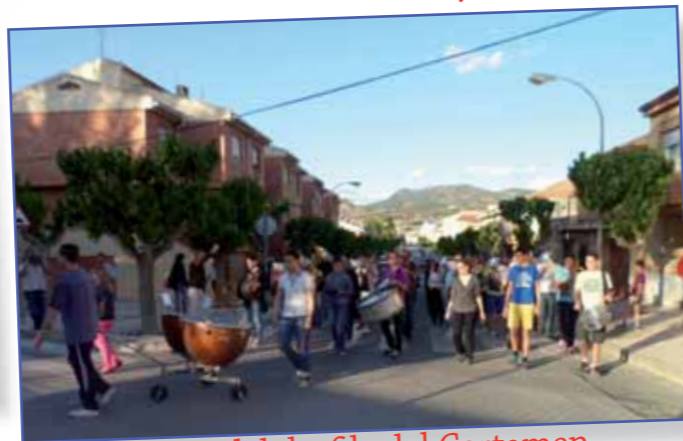
Ensayo del desfile del Certamen