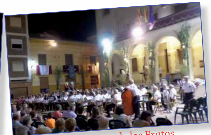
Concierto Virgen de los Frutos