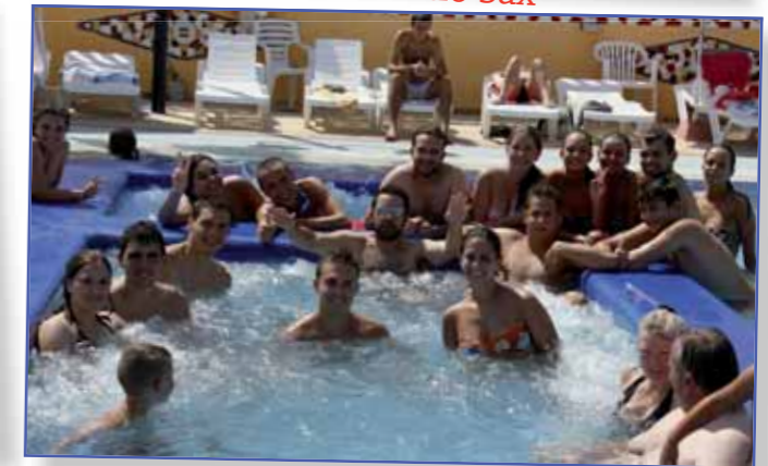
De relax en Fortuna